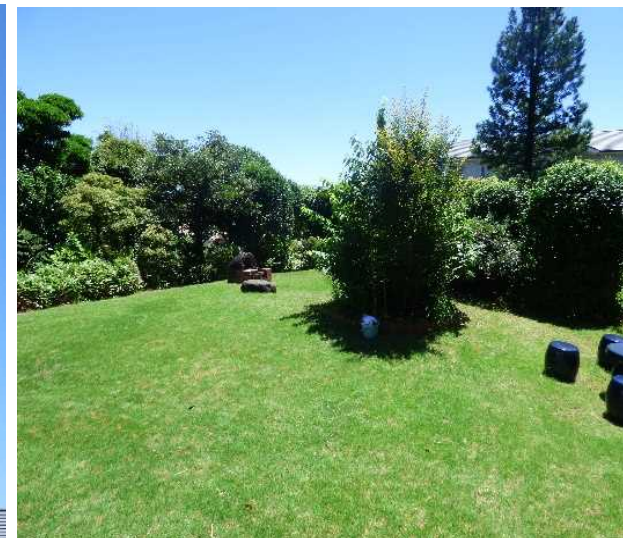
南側に広がる芝生庭