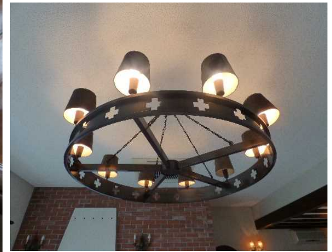
リビングルームのシャンデリア

約30畳のLDルームには、ダイニングスペース リビングスペースがゆとりをもって配置されています。