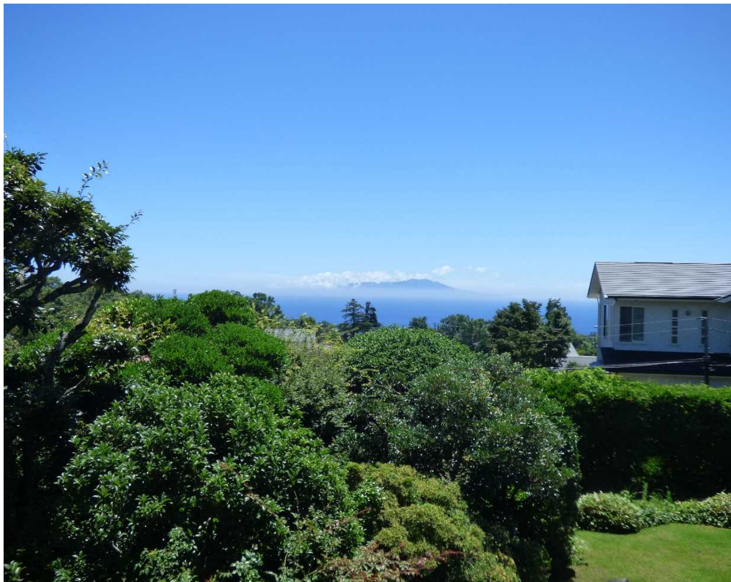
2階バルコニーからの眺望。伊豆大島、相模灘を望む

南緩斜面の高台立地の好条件を活かした眺望が魅力な設計。 道路からはフラットに導入、開放的な南面には手入れされた芝生庭園