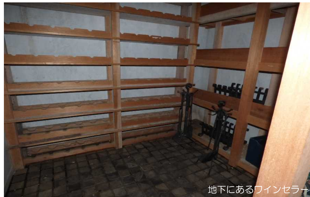
地下にあるワインセラー