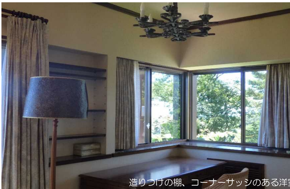
造りつけの棚、コーナーサッシのある洋室