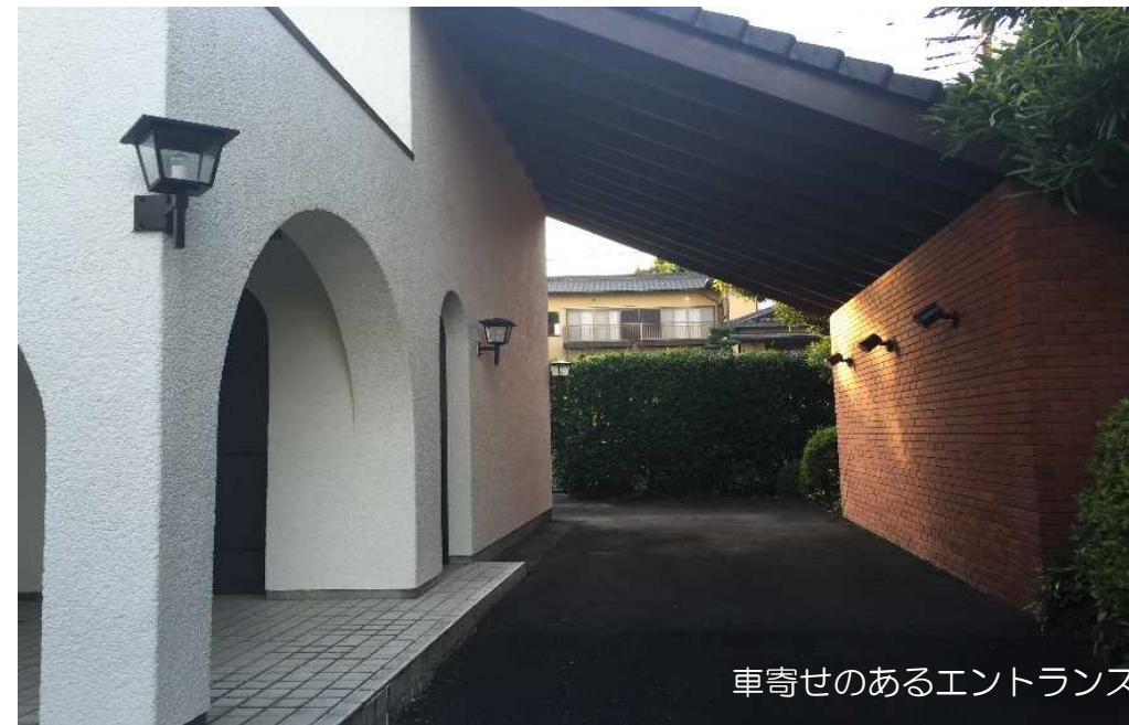
車寄せのあるエントランス