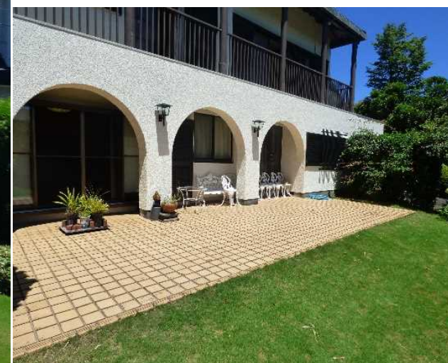
1階居室前にはタイル貼りのテラス