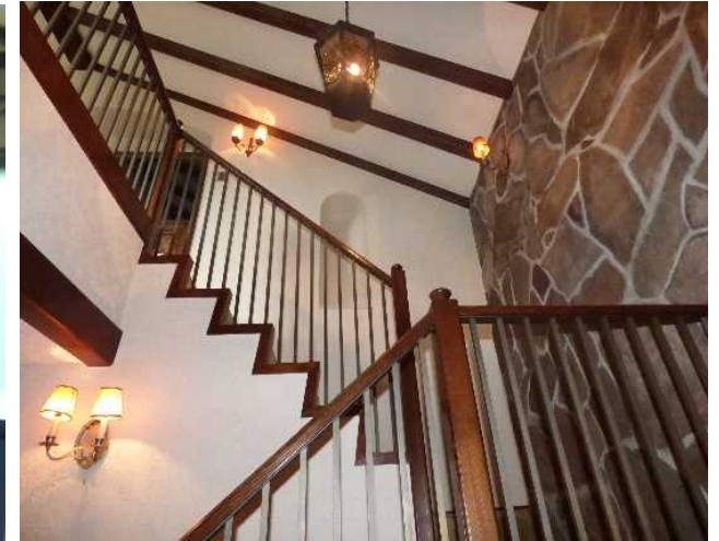
玄関ホールからリビングルームをつなぐ吹抜け