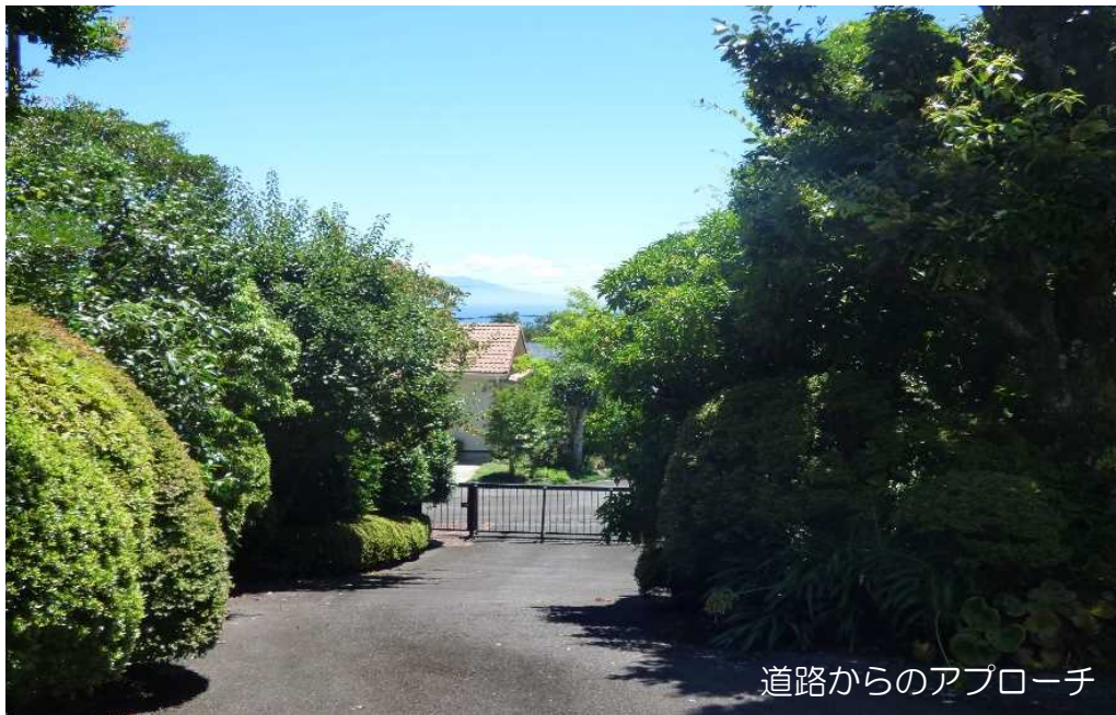
道路からのアプローチ